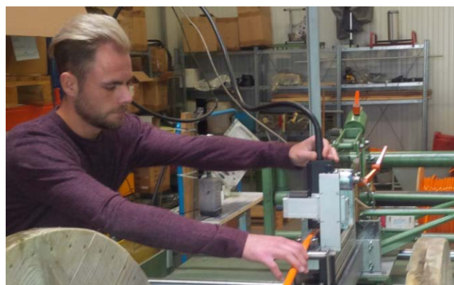
Pan Aust od samego początku obsługuje alphaJET

Heidrich-Elektro doskonale orientuje się w sytuacji i jako wyjątkową usługę serwisową oferuje indywidualną personalizację przedłużaczy – nawet dla minimalnej liczby sztuk.