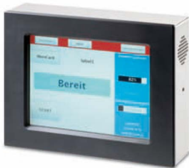
Touch Panel (optional)